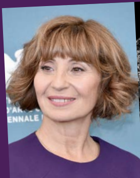
L'actrice Ariane ASCARIDE sera parmi nous !

Au 109, le pôle des cultures contemporaines de Nice (jauge limitée, sur réservation sur notre site) : lectures, projection de films, débats, exposition photo, concerts.