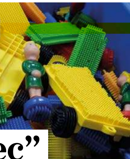
LES COINS JEUX nécessitent de l'aménagement et de l'espace.