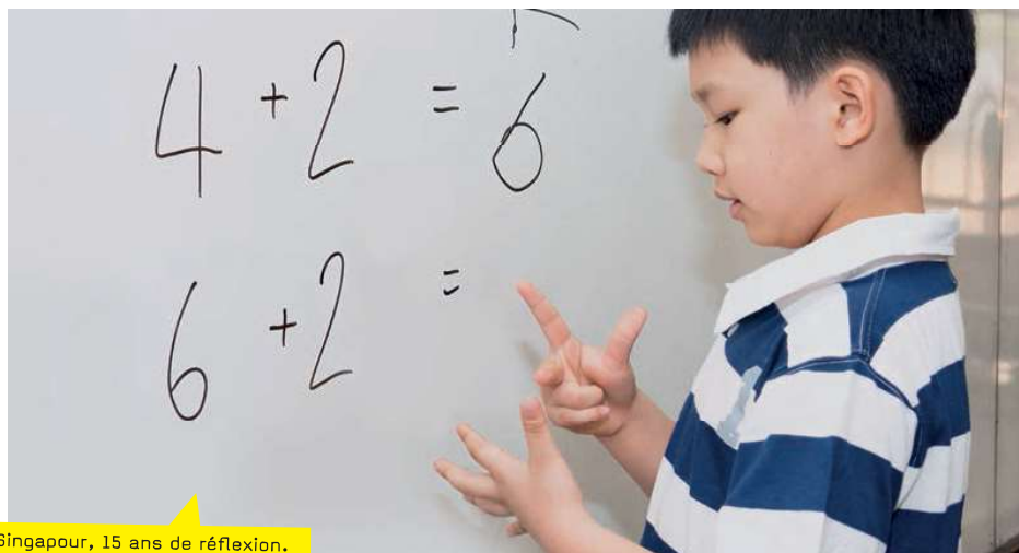
Singapour, 15 ans de réflexion.

D ernier avatar de « la méthode qui marche », le Singapore mathematics project fait aujourd'hui l'objet de toutes les attentions de Jean-Michel Blanquer... et des médias. Mais de quoi s'agit-il exactement ? Dans les années 80, Singapour décide de faire des mathématiques une priorité nationale pour son développement. Une équipe de didacticiens examine pendant cinq ans les différentes recherches effectuées partout dans le monde sur l'apprentissage des maths, puis propose une démarche originale d'enseignement autour de quelques principes clé. Traiter moins de sujets et un à la fois. Les traiter en profondeur à partir de situations concrètes, de manipulations, puis les mettre en « images » variées et, seulement ensuite, passer à l'abstraction. Enfin, placer la résolution de problèmes au cœur des apprentissages en encourageant la verbalisation des démarches et le dialogue entre pairs et avec l'enseignant.